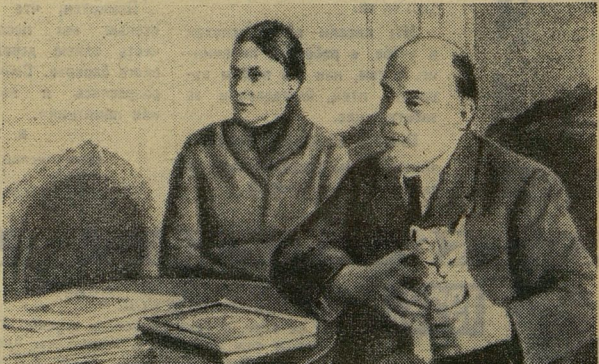
В. И. Ленин и Н. К. Крупская. Зима 1920—1921 года.